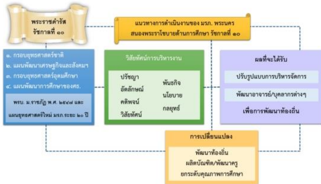
แผนภูมิแสดง วิสัยทัศน์การบริหารงาน มหาวิทยาลัยราชภัฏพระนคร